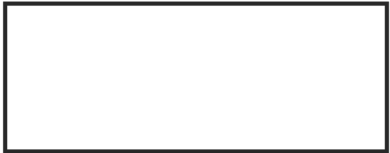
Format 2460 px * 936 px