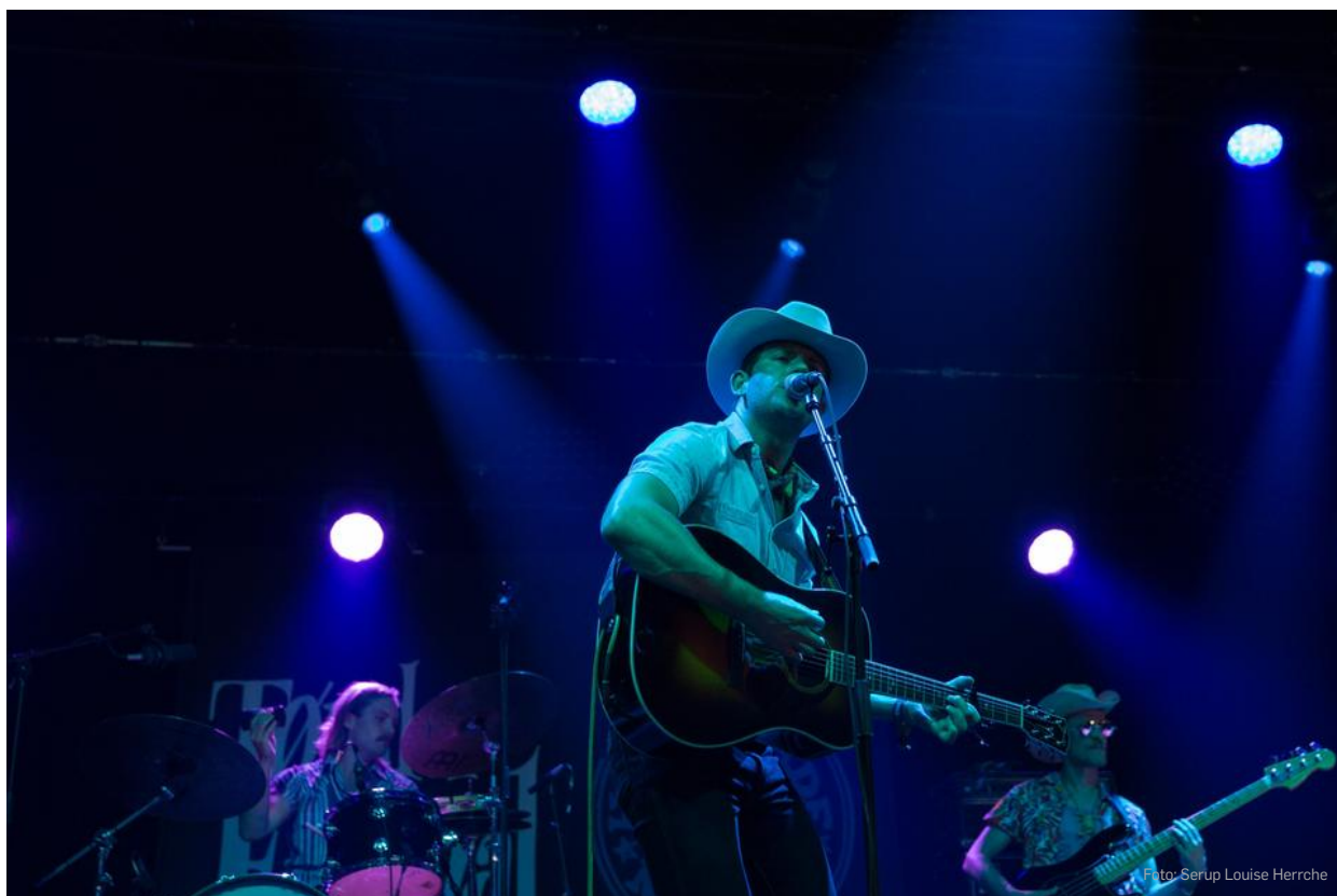
Tønder Festival 2017 Sam Outlaw

*Gælder ved køb af komplet brille 28.8-2.9.2017 og kan ikke kombineres med Lifestyle Abonnement, andre rabatter og organiserede rabatter.